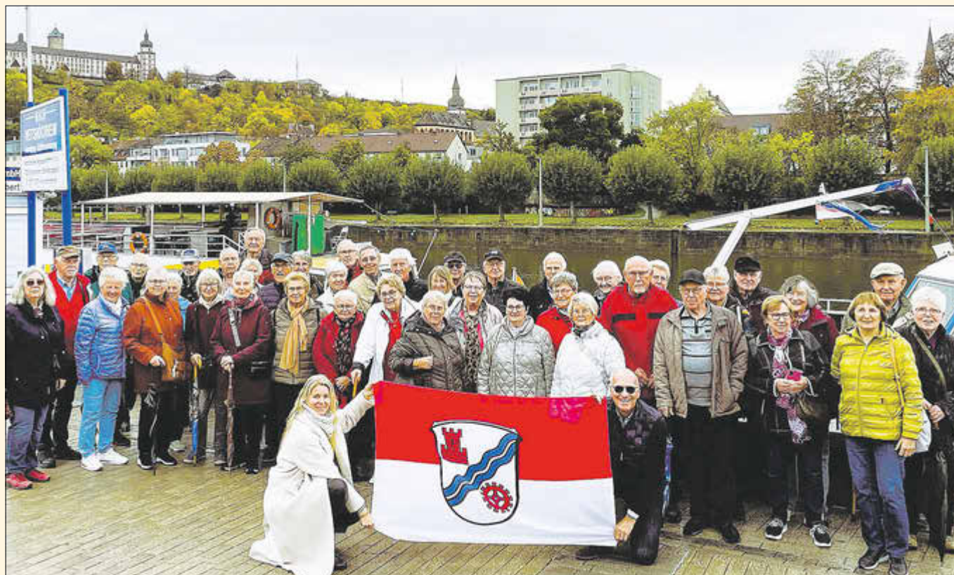
Einen schönen Tag verbrachte die Ludwigsauer Reisegruppe in Würzburg und anschließend während einer Schifffahrt auf dem Main nach Veitshöchheim.