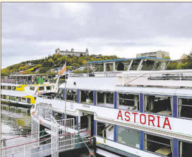
Die 51 Metern lange und 9 Meter breite „Astoria“ wartete bereits am Mainufer auf uns. Es war eine der letzten Fahrten des Fahrgastschiffes vor der Winterpause.