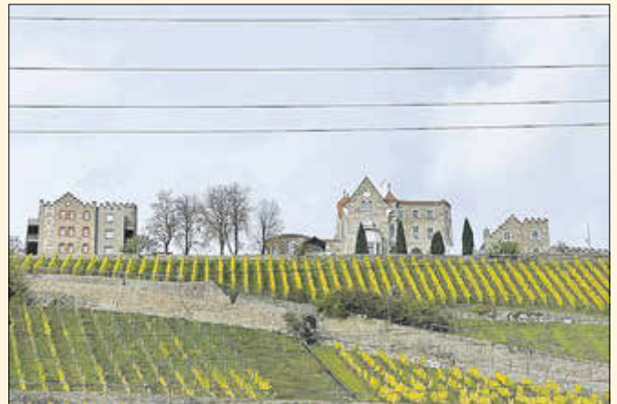
Vom Schiff aus hatten wir einen herrlichen Blick in die Weinberge. Oberhalb gelegen das historische Gebäude „Schloss Steinburg“. Es dient heute als Schlosshotel.