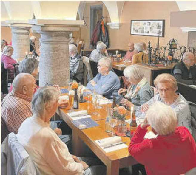
Das Wirtshaus „Bürgerspital-Weinstuben“ war der passende Ort für ein gemeinsames Mittagessen in geselliger Runde.