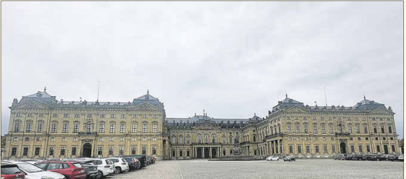
Die Residenz, der ehemalige Sitz der Fürstbischöfe, war eines unserer Ziele während der Stadtrundfahrt in Würzburg.