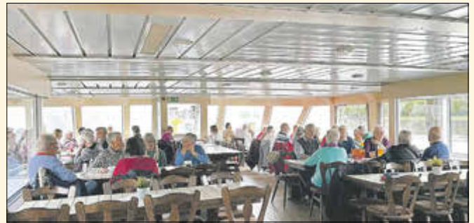
Viel Platz an Deck. Auch hier blieb bei Kaffee & Kuchen Zeit für Gespräche und Begegnungen; es war ein schönes Miteinander.