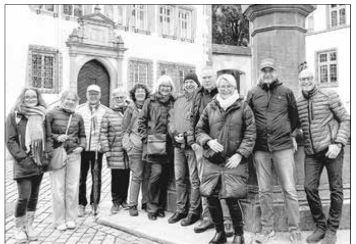
Nach dem Gruppenbild am Lullusbrunnen vor dem Rathaus, gab es dann bei Kaffee und Kuchen noch einiges zu erzählen.