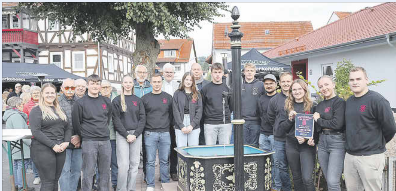
Die Rohrbacher Bürgerinnen und Bürger und zahlreiche Ehrengäste haben rechtzeitig zum „Tag der Deutschen Einheit“ den Dorfbrunnenplatz in der Ortsmitte eingeweiht.