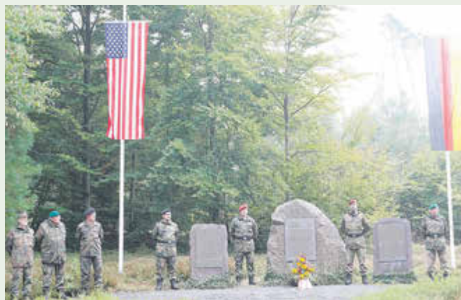
Die Reservisten der Kreisgruppe Osthessen