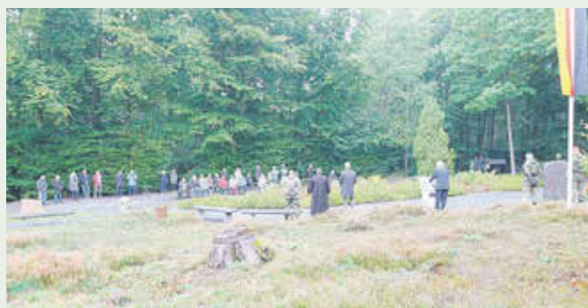
Auch einige Ludwigsauer Bürger waren gekommen.