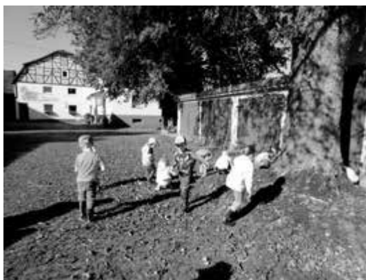
Picknick im Grünen

Kastanien sammeln bei Familie Claus an der Fuldamühle