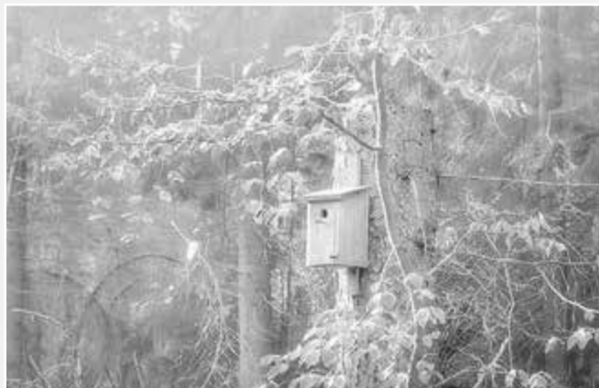
Titelbild des Ludwigsau-Kalenders 2025: „Wärmende Sonnenstrahlen“

Für den Gemeindevorstand der Gemeinde Ludwigsau gez. Patrick Kuhn Bürgermeister