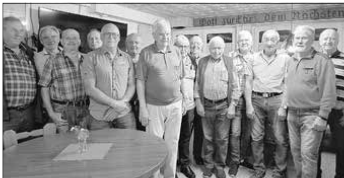
Alte Herren am 18.9.25 in Gerterode

Über rege Beteiligung würden wir uns freuen.