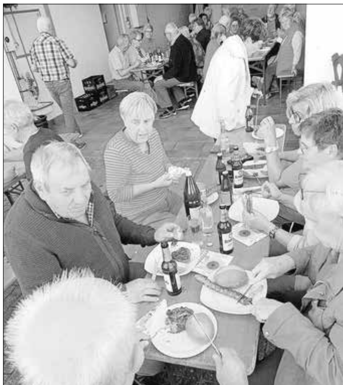
Sommerfest 2025 mit Silbermond im Vordergrund

Wer nicht mit wandern kann oder möchte, melde sich bei Peter Fricke (06621-14137) zur Mitfahrt.