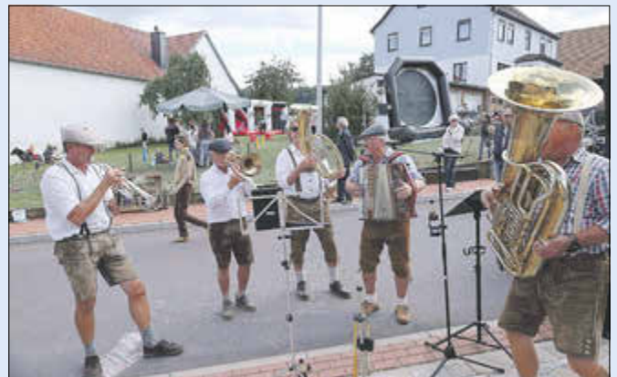
Die Kapelle „Blechgedöns“