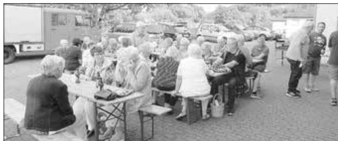
Das war 2023

Bei Regen bietet uns das Gerätehaus Schutz.