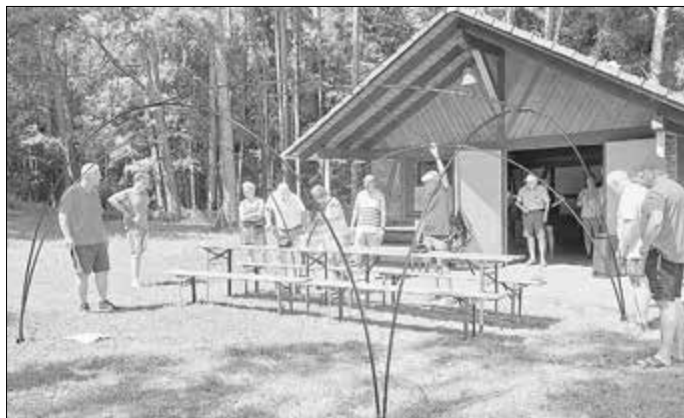
Großes Interesse der Mitglieder beim Aufbau des Eventzelts!

Somit ging wieder ein gelungenes Event am 29.06.25, welches wieder zahlreichen Zuspruch fand, zu Ende.