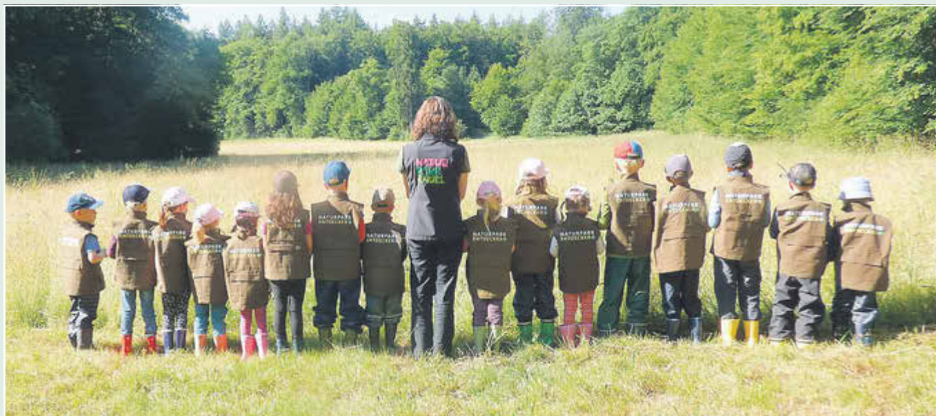
Kleine Naturpark-Entdecker unterwegs: Die Naturpark-Kita Mecklar erhielt Naturpark-Entdeckerwesten

Im Naturpark Knüll sind bislang zwei Kitas als Naturpark-Kita zertifiziert: der Kindergarten Mecklar und die AWO-Kita Altstadt in Homberg (Efze). In einer Naturpark-Kita beschäftigen sich die Kinder auf ganz besondere Weise mit ihrer Region. Sie lernen auf der Grundlage einer Bildung für nachhaltige Entwicklung Natur und Landschaft, regionale Kultur und Handwerk sowie Land- und Forstwirtschaft hautnah und mit allen Sinnen kennen und werden so für ihre Region und deren Besonderheit begeistert. Diese Themen kommen im Kita-Alltag vor, werden auf Exkursionen und während Projekttagen behandelt. Bei der Organisation arbeiten Naturpark und Kita eng zusammen. Deutschlandweit gibt es ein ganzes Netzwerk von Naturpark-Kitas, da das Projekt über den Verband Deutscher Naturparke entwickelt wurde.