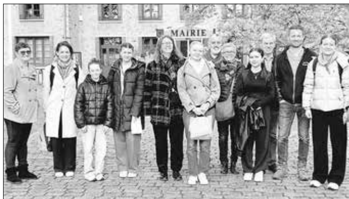
Die Praktikantinnen mit ihren Gastfamilien vor dem Bürgermeisteramt in Changé.

Zum Abschluss der Saison stand mit RSG Ginsheim V eine Mannschaft gegenüber, die zwingend einen Sieg benötigte, um die direkten Abstiegspätze zu verlassen. In einer spannenden Begegnung kämpfte sich Tann mehrfach zurück ins Spiel, was 30 Sekunden vor Schluss mit dem 5:4-Siegtreffer belohnt wurde.