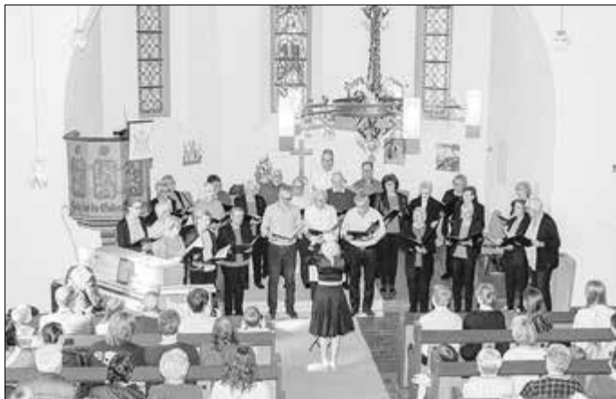
Der Gemischte Chor Friedlos bei dem Konzert im letzten Jahr