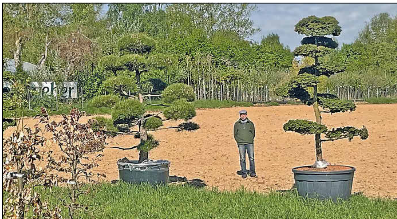
Erweiterung der Anzuchtfläche im 50. Jahr des Bestehens der Baumschulen Leinweber