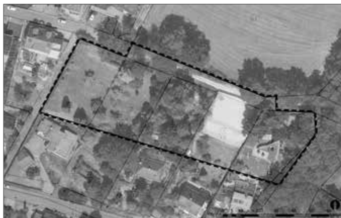
Luftbild des Plangebietes mit Darstellung der wesentlichen Teile der Planung.

Der Entwurf der 1. Änderung des Bebauungsplanes Nr. 3 " Über dem Friedhof " im Ortsteil Rohrbach mit Artenschutzrechtlichen Fachbeitrag liegt gemäß § 3 Abs. 2 BauGB in der Zeit