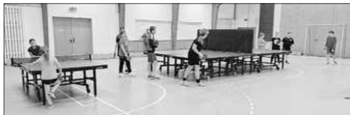
Bild vom Abschlusstraining unseren SG-Nachwuchses in der Besengrundhalle in Tann am 18.12.2025