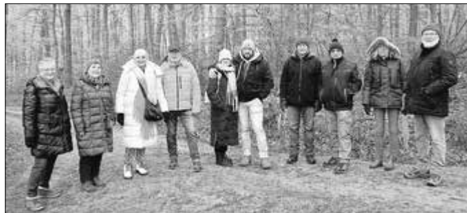
Der Hauptanstieg ist schon geschafft: Foto-Pause auf Höhe „Vor den Tannen“.