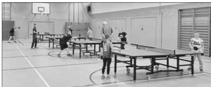
Bild vom Nachwuchstraining in der Schulturnhalle Friedlos als Ausweichhalle zur Besengrundhalle

Die Antwort darauf ist top! Mit 9:7 Punkten und 42:38 Spielen steht die SG auf Platz 4 der Hinrundentabelle. Von 9 teilnehmenden Teams hat man doch gleich einige hinter sich lassen können. Ohne Fleiß kein Preis, so ging man die Serie an und man sieht der Trainingsfleiß zahlt sich in Punkten aus. Gratulation an unseren SG-Nachwuchs für die tolle Halbzeitbilanz und macht weiter so in 2026!