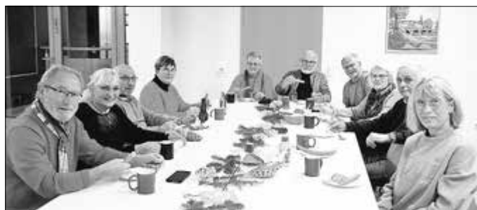
In gemütlicher Runde im Bürgerhaus: Zu einer leckeren Wurst sagt niemand „Nein“.