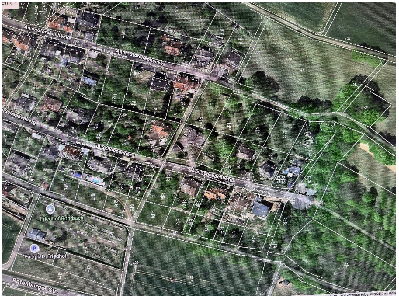
Abb.: Verortung des Plangebietes

Das Plangebiet befindet sich in Gemeinde Ludwigsau, Ortsteil Rohrbach. Der räumliche Geltungsbereich umfasst die in der Gemarkung Rohrbach in der Flur ... liegenden Grundstücke mit der Flurnummer 77/8; 77/10; 77/12; 77/13 und die 77/14.